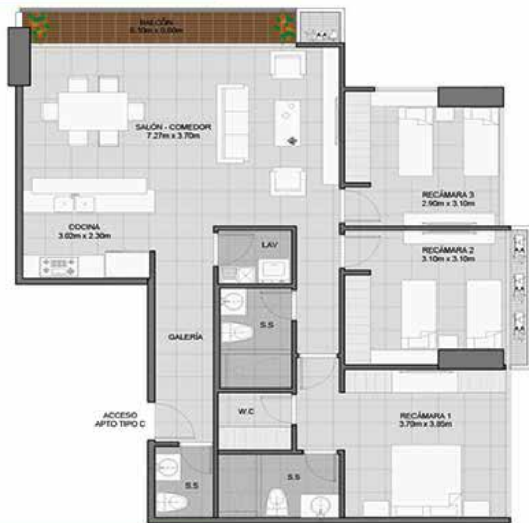
UNIDAD C 124.10M2